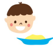
TABLE FOR TWOを通じて アフリカ・アジアの 子どもたちに給食が届く

日本のソウルフードである「おにぎり」をシンボルとして、世界を変えることを目指すこのアクションは2015年に始まり、2018年までに世界50カ国以上から、のべ148万人が参加しました。昨年は累計で20万枚以上のおにぎり写真が集まり、約100万食の給食をアフリカ・アジアの子どもたちに届けました。