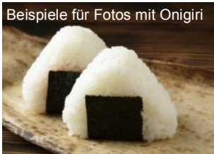
Beispiele für Fotos mit Onigiri

Besuchen Sie die Kampagnenwebsite von „Onigiri Action“, um ein Foto zu veröffentlichen. Oder posten Sie ein Foto bei Facebook, Instagram oder Twitter mit #OnigiriAction. Um teilzunehmen, besuchen Sie bitte https://de.tablefor2.org/onigiri .